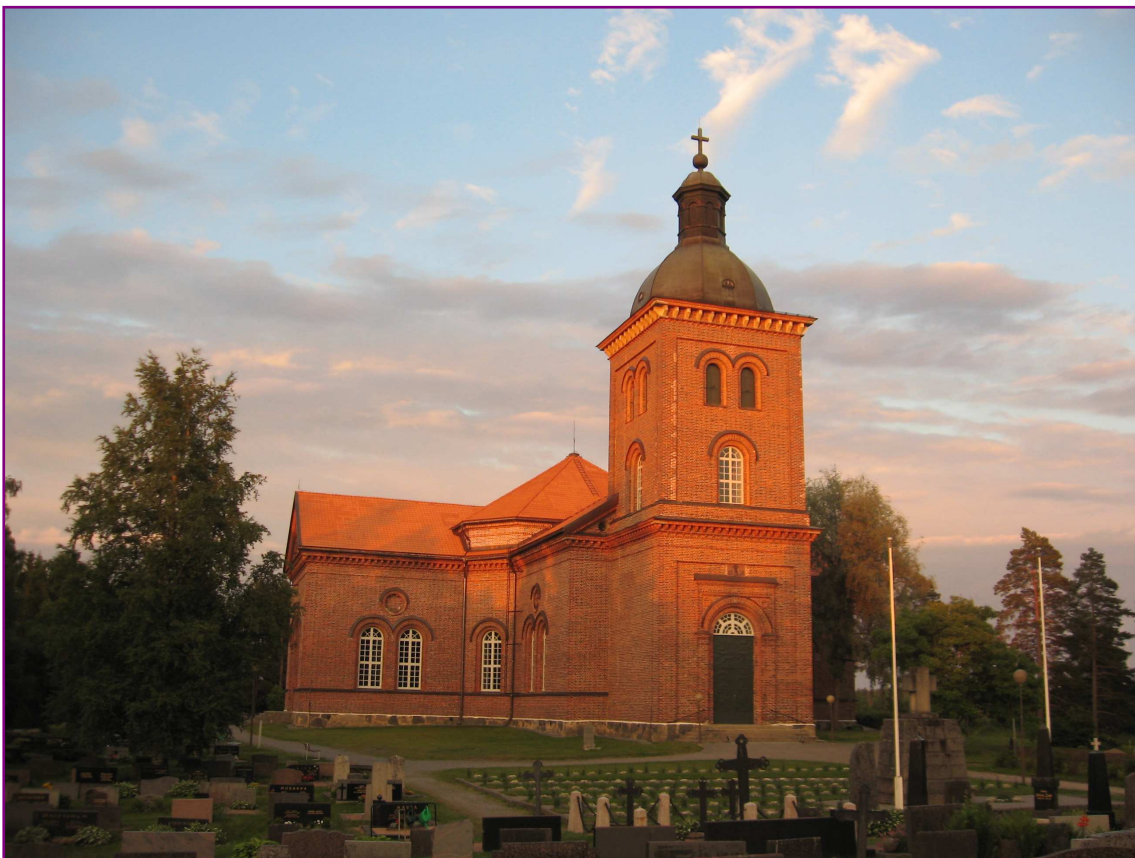
Vuonna 1858 valmistunut Mouhijärven kirkko muistuttaa tyyliltään kolme vuotta vanhempaa Tyrvään kirkkoa. Molemmat kirkot edustavat uusgoottilaista tyyliä ja ovat Pehr Johan Gylichin suunnittelemia.