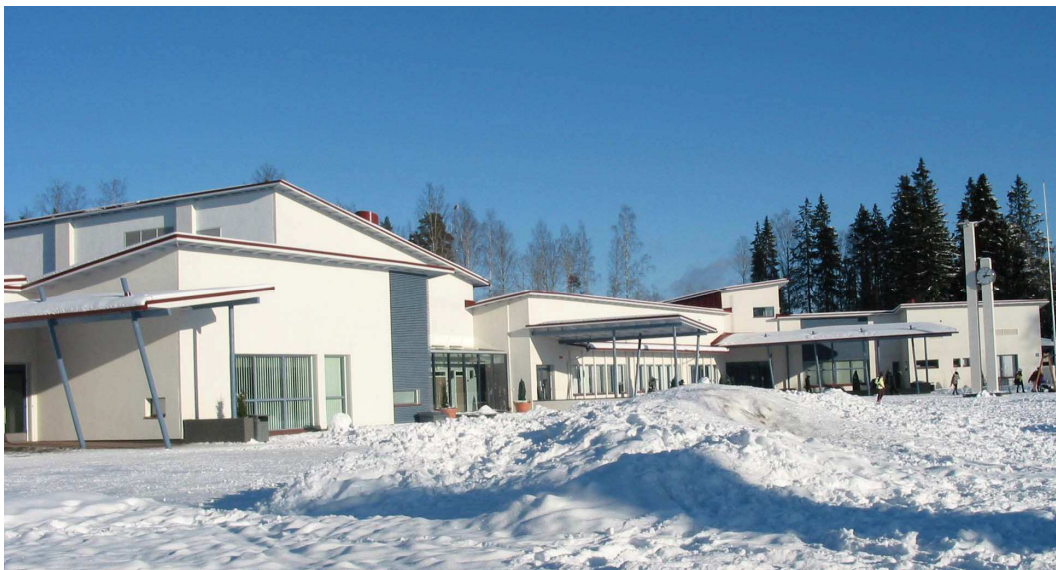
Stormin monipalvelukeskus, jossa toimi mm. alakoulu ja päiväkoti.