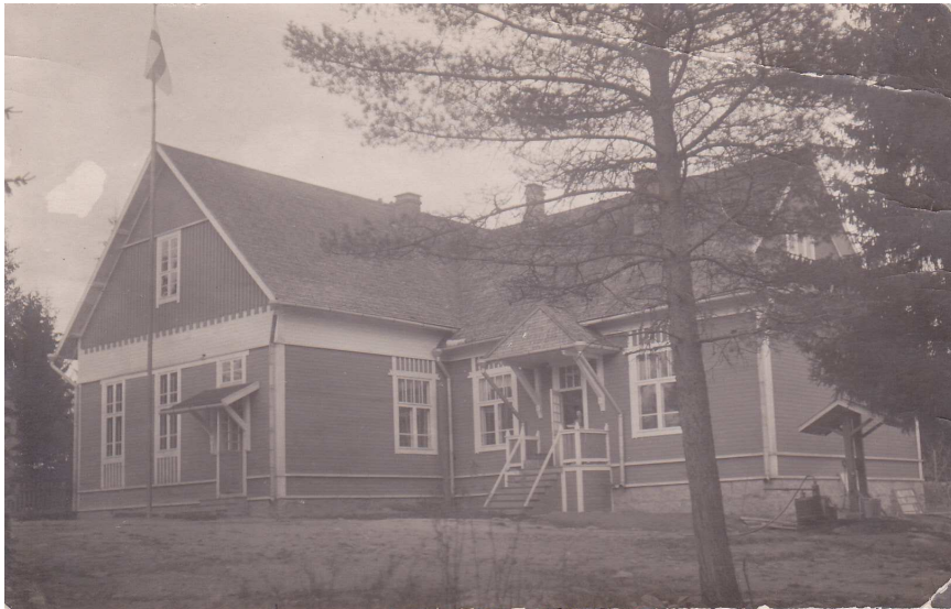
Myönteeseen kylän viljapeltoja 1970-luvulta ja Myönteeseen koulu 1930-luvulta.