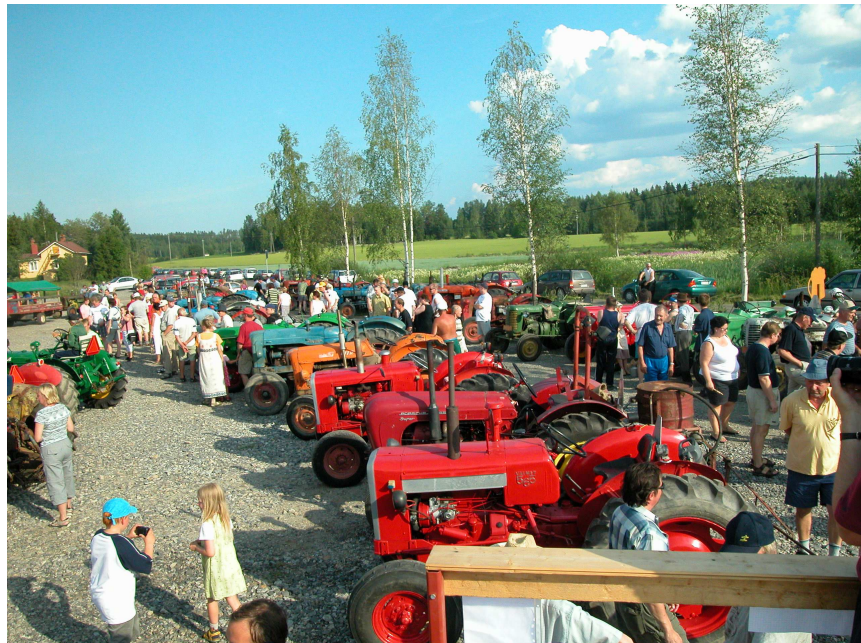
Kutalan Kasino ja hytittömien traktorien kokoontumisajot ovat olleet Kutalan 2000-luvun alun vetonauloja.