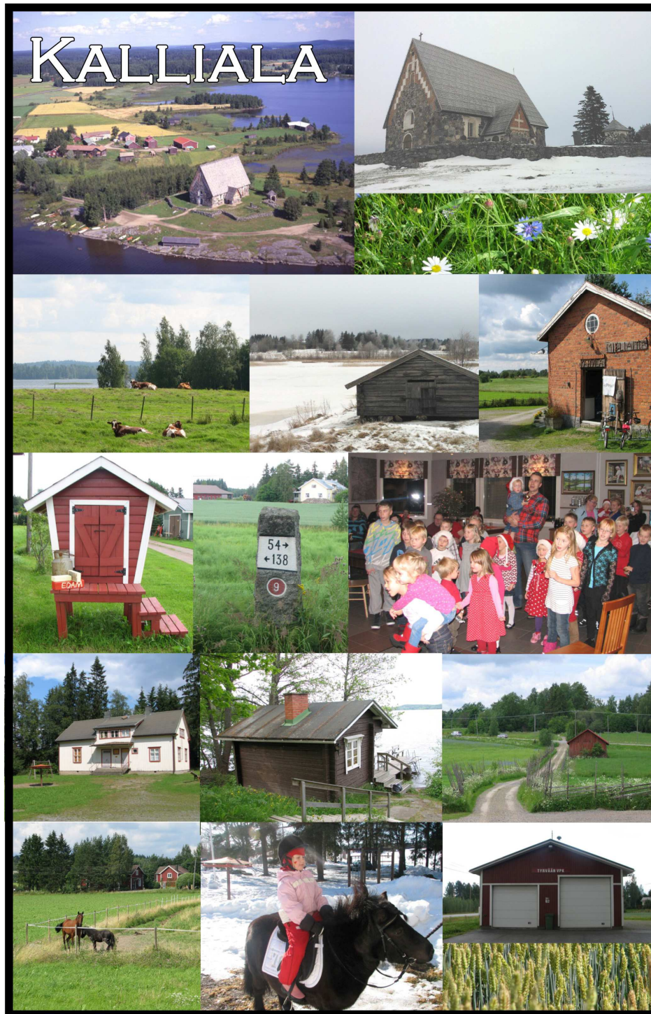
Kuvakollaasi Kallialasta.