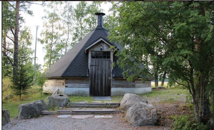
Vähähaaran Kotiseututalo ja kota.