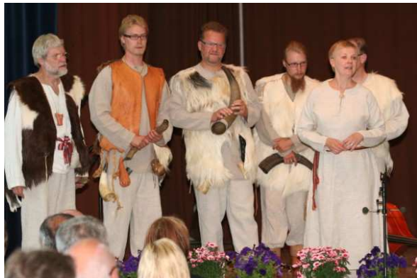
Kiikoisten Purpuri-juhlat.