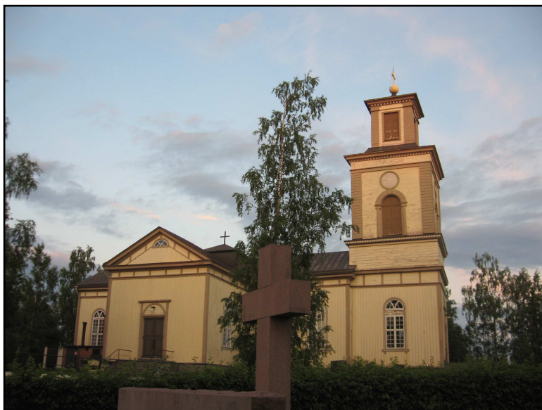
Suodenniemen vuonna 1831 valmistunut kirkko. Kirkon ovat suunnitelleet Charles Bassi ja A. W. Arppe.