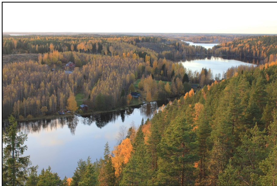
Näkymä Pirulanvuoren 15-metrisestä näkötorresta, joka avattiin syksyllä 2012. Kuvasa Palojärvi, Miekkajärvi ja kauimpana Lavian puolella sijaitseva Lavijärvi.