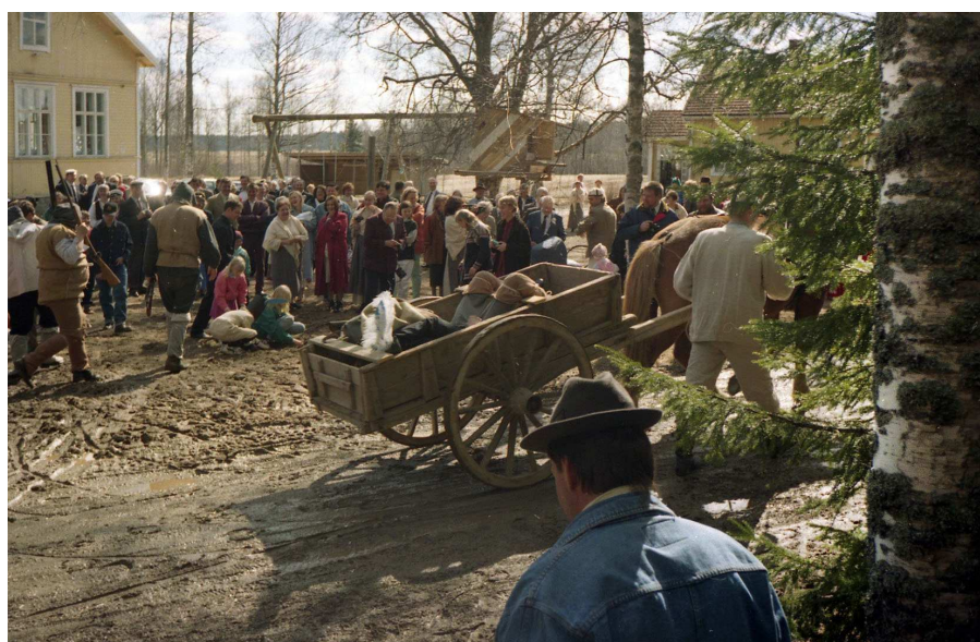
Sävin koulun 90-vuotisjuhla vuonna 1996. Juhlassa muisteltiin lähellä tapahtunutta venäläisen rahankuljetuskuriirin ryöstöä Suomen sodan 1809 ajoilta.