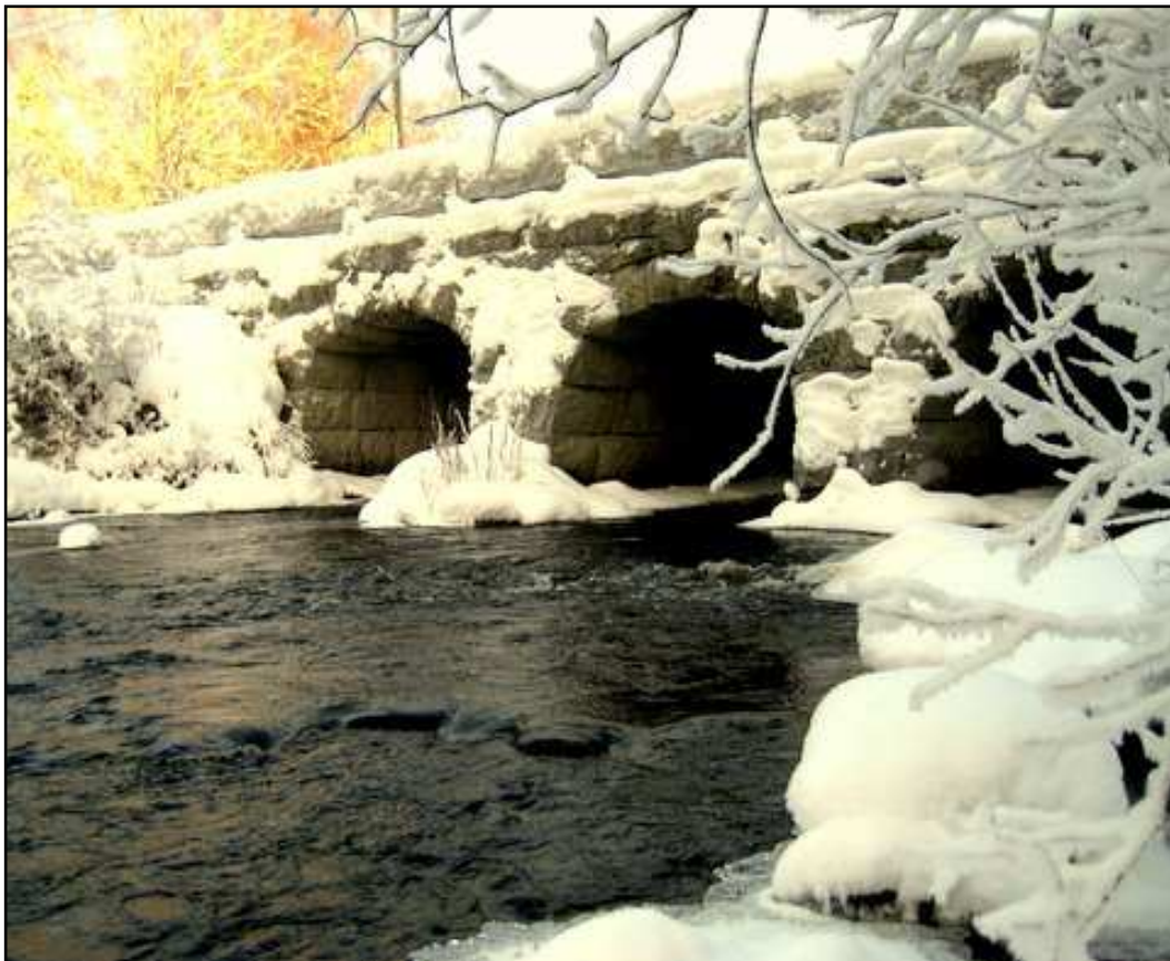
Putajan 3-aukkoisen kivisilta.