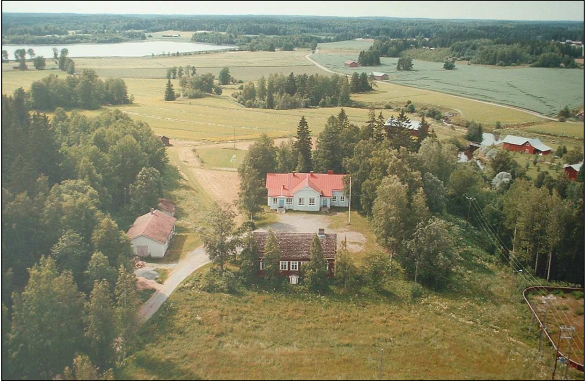
Pukaran kylää vuodelta 2004, etualalla kylätalo ja taustalla Hahmajärvi.