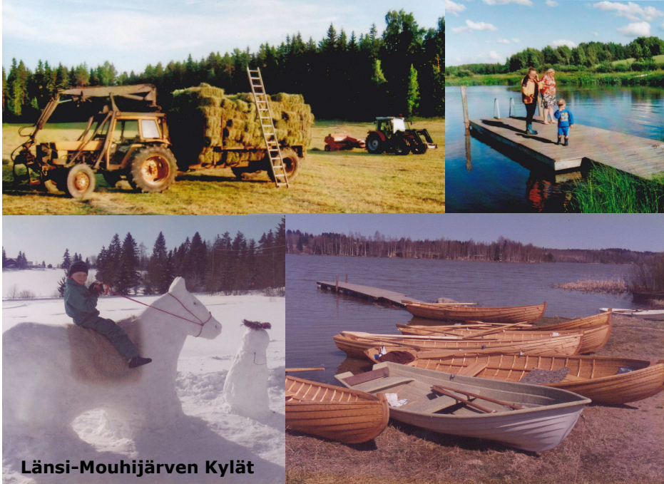
Kuvakollaasi Länsi-Mouhijärven kylistä.