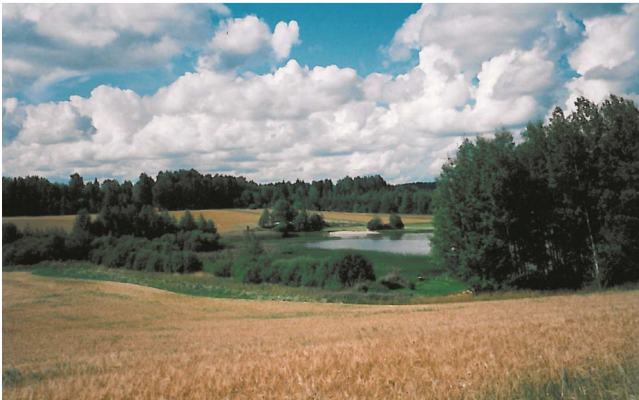
Kallojärvi sijaitsee peltojen keskellä valtatie 11 tuntumassa (kuva: Katariina Pylsy).