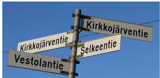
Mouhijärven kesäkappeli sijaitsee Kirkkojärven itäpuolella ja on rakennettu vuonna 1999.