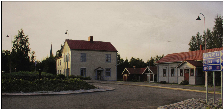
Kiikan kyläseurantalot kuvassa oikealla.