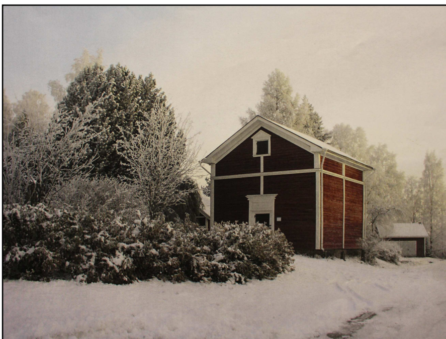
Kiikan yli 150-vuotias lainamakasiini.