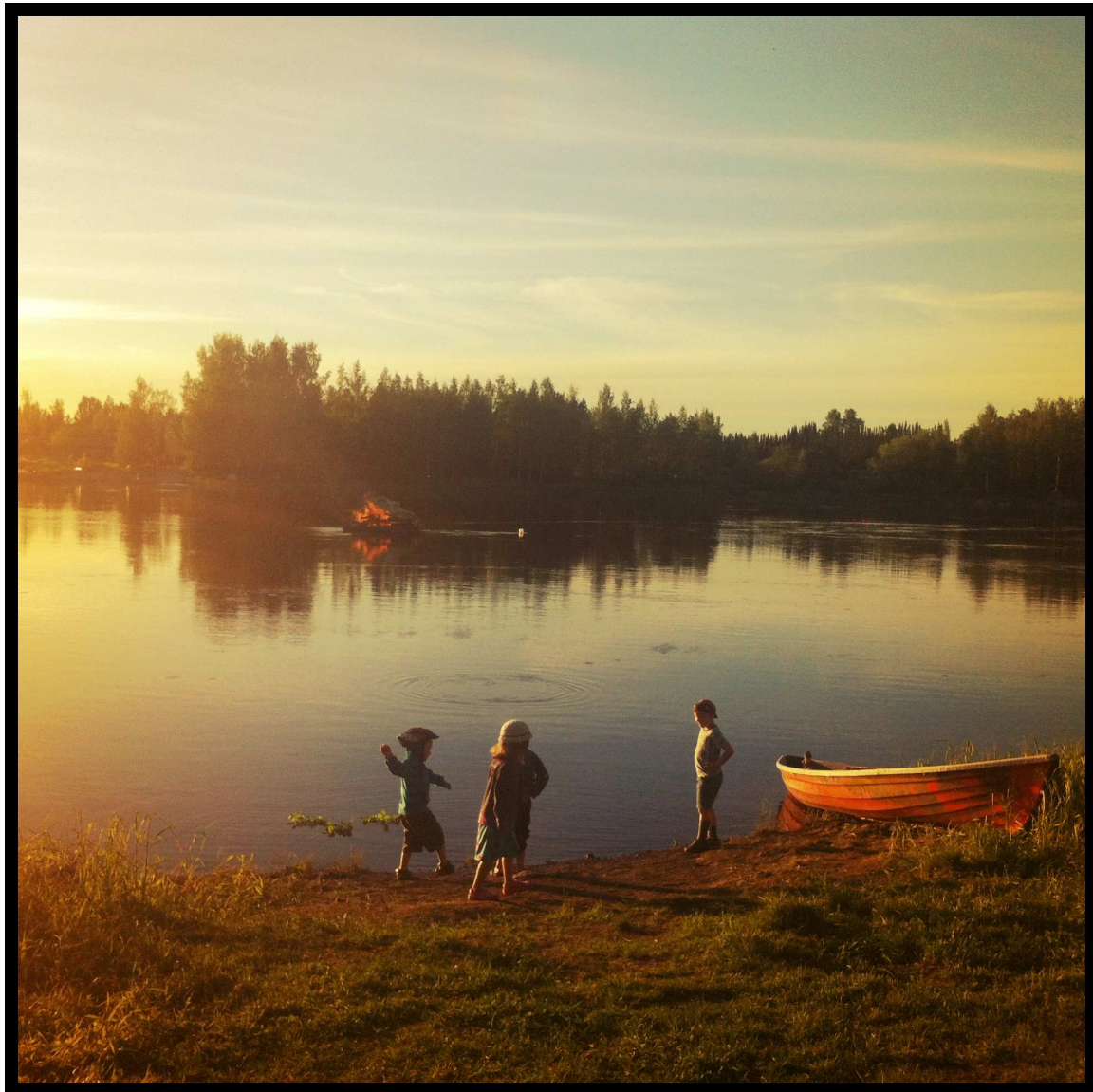
Kiikan Jokisivun Lauttaranta (kuva: Piia Jaatinen).