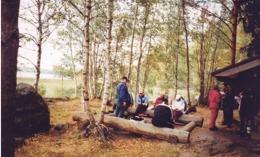
Mouhijärven itäpäässä sijaitsee Vesunninlahti, jonka rannalla on laavu ja uimaranta.