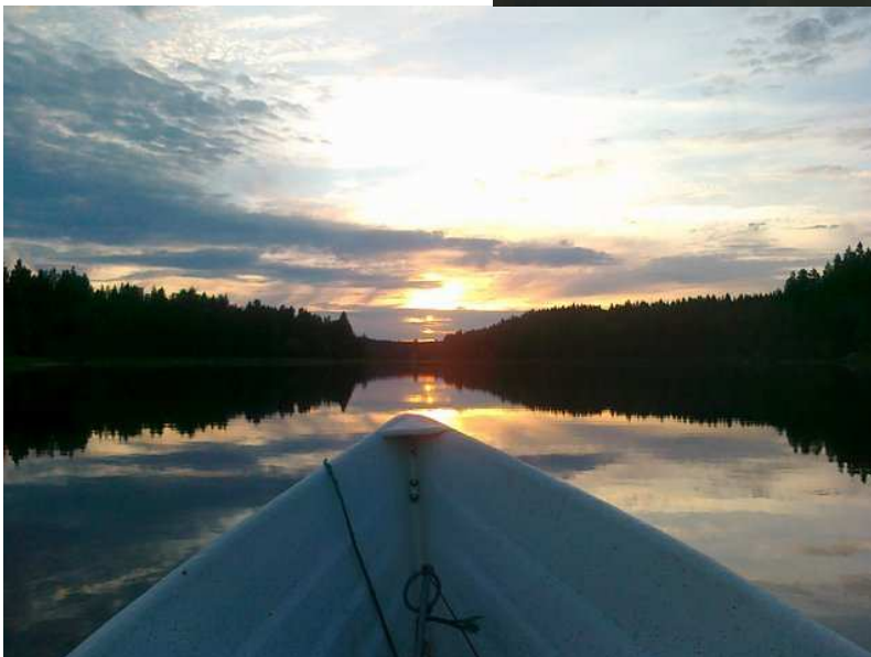
Hyynilän Kortejärveä.