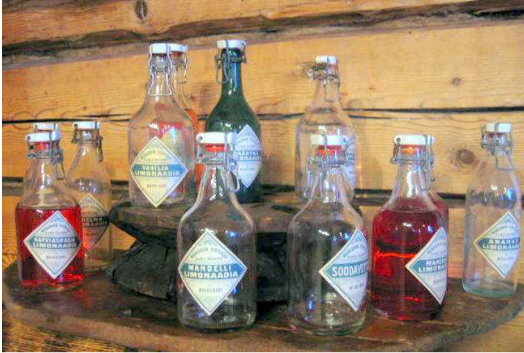
Mouhijärven Vesitehtaan pulloja (kuva: Pekka Mäkelän kotialbumi).