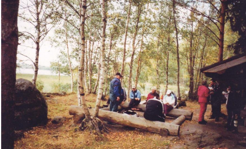
Mouhijärven itäpäässä sijaitsee Vesunninlahti, jonka rannalla on laavu ja uimaranta.