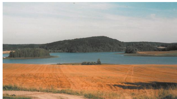
Tupurlanjärvi ja Ryömälänvuori.