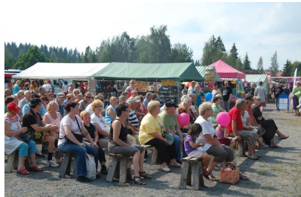
Häijään Markkinat.