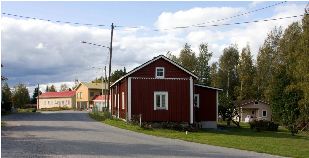
Stormin kylänraittia (kuva: Urpo Vuorenoja).